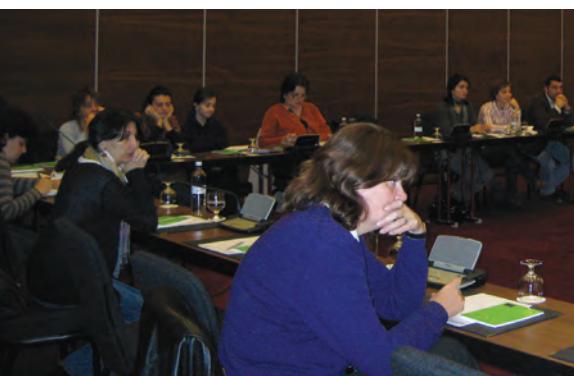
ჰაინრიჰ ბიოლის ფონდი (2009): “საერთაშორისო კონფერენცია”, თბილისი

სოფლებსა და დასახლებებს ადრე არასდროს სწევია განვითარების რომელიმე პროექტი, ბევრი მონაწილისათვის ეს საგანმანათლებლო შეხვედრები ამა თუ იმ საჯარო საქმიანობაში ჩართვის პირველი გამოცდილება აღმოჩნდა.