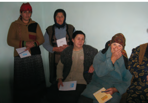
ჰაინრიჰ ბიოლის ფონდი (2008): “ამომრჩეველთა განათლების პროგრამა”, მარნეული