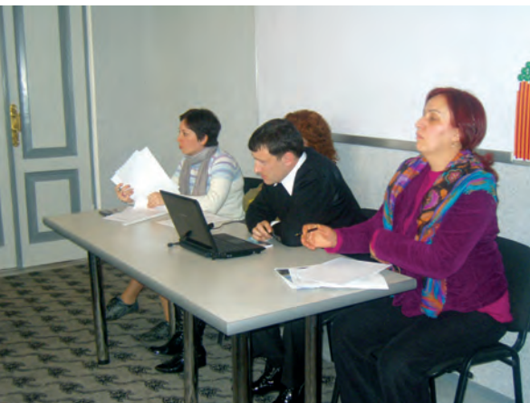
ჰაინრიჰ ბიოლის ფონდი (2008): “საჯარო დებატები”, ბათუმი

ჩართულიყვნენ პოლიტიკურ პროცესებში. განსაკუთრებული აქცენტი კეთდებოდა ქალების, სომეხ და აზერბაიჯანელ მოსახლეობის და დევნილების მიმართ.