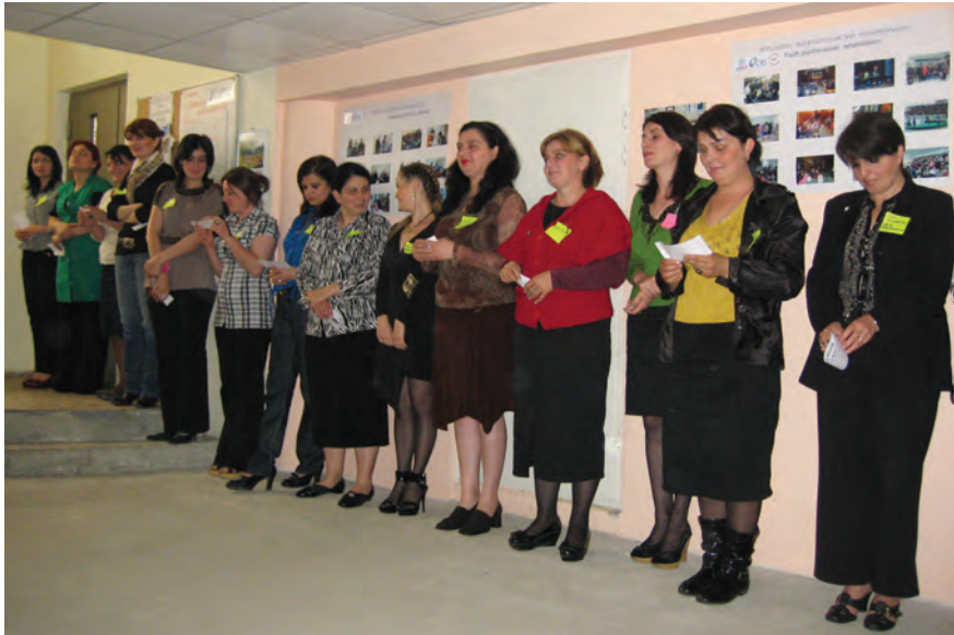
ჰაინრიჰ ბიოლის ფონდი (2009): “სემინარი ადგილობრივი თვითმმართველობისთვის”, ქუთაისი

მეტიც, ქალებმა, ვინც უმნიშვნელო რაოდენობით არჩეული იქნენ მაღალ პოლიტიკურ თანამდებობებზე, ვერ მოახერხეს, დაეჭირათ მტკიცე პოზიცია გენდერული თანასწორობის და ქალთა საკითხებში, ნაწილობრივ იმიტომაც, რომ ამგვარი საქმიანობისათვის, შეიძლებოდა, ისინი კოლეგებსა და ფართო საზოგადოებას გაეკრიტიკებინა.