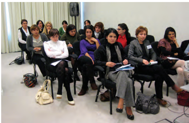
ჰაინრიკ ბიოლის ფონდი (2009): “საერთაშორისო კონფერენცია”, თბილისი

პროექტის განხორციელებისას წარმოიქმნა გარკვეული სიძნელებები, რომელთა მიზეზითაც ზოგი აქტიობა გადავადდა, ზოგი კი გაუქმდა. ეს სირთულეები მეტწილად გამოიწვია პოლიტიკურმა არასტაბილურობამ, რომლის წინასწარგანჭვრეტაც შეუძლებელი იყო. 2007 წლის ნოემბერში საქართველოში დაიწყო მასიური დემონსტრაციები, ამას მოყვა პრეზიდენტის განცხადება გადადგომის შესახებ და დაინიშნა ვადამდელი საპრეზიდენტო არჩევნები, რაც დანიშნულ ვადაზე, ანუ 2008 წლის მაისზე 5 თვით ადრე ჩატარდა (ჩივერსი 2009). ეს გარემოება განსაკუთრებით აისახა ამომრჩეველთა განათლების კომპონენტზე. პოლიტიკურმა არასტაბილურობამ კულმინაციას რთულ წინასაარჩევნო პერიოდში მიაღწია, რამაც ქალი კანდიდატების და პოლიტიკოსების დანიშნულებისათვის გათვლილი აქტივობები შეუსაბამო გახადა. ეს აქტივობები დამუშავდა და აქცენტი გენდე-