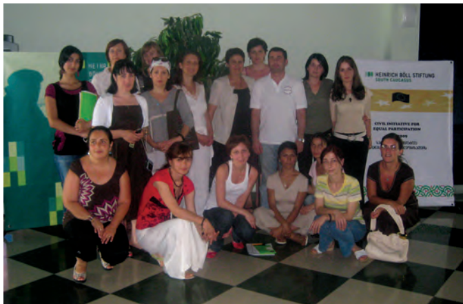
ჰაინრიჰ ბიოლის ფონდი (2009): “საზაფხულო სკოლა რეგიონული ლიდერებისთვის”, ბათუმი

პროექტის შემაჯამებელი ღონისძიება გახლდათ საერთაშორისო კონფერენცია “გენდერული თანასწორობის გაუმჯობესება საქართველოში”, კონფერენციის პირველ დღეს მონაწილენი მსჯელობდნენ კანონპროექტზე გენდერული თანასწორობის შესახებ, რომელიც განსახილველად 2009 წელს წარედგინა პარლამენტს. კონფერენციის სამუშაო ჯგუფებში დამატებით ოთხი მნიშვნელოვანი თემა განიხილებოდა. „ქალები პოლიტიკაში“ თემის განხილვისას ყურადღება იქნა გამახვილებული ქალის როლზე თანამედროვე პოლიტიკაში და საქართველოში გადაწყვეტილების მიმღებ პროცესებში ქალების მონაწილეობის შესაძლებლობებზე. თემა “ქალის როლი კონფლიქტების დარეგულირებაში” მიეძღვნა ქალის ბუნებრივ, ტრადიციულ და ისტორიულ როლს. ხოლო თემამ „ქალთა ეკონომიკური მდგომარეობის გაუმჯობესება“ დღის წესრიგში დააყენა ქვეყანაში გენდერული პრობლემების გადაჭრის აუცილებლობა, რომელიც, ერთი მხრივ,