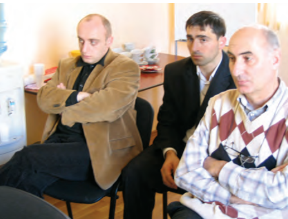
ჰაინრიჰ ბიოლის ფონდი (2008): “საჯარო დებატები”, ქუთაისი