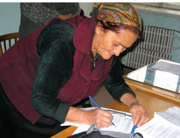
ჰაინრიჰ ბიოლის ფონდი (2008): “ამომრჩეველთა განათლების პროგრამა”, მარნეული