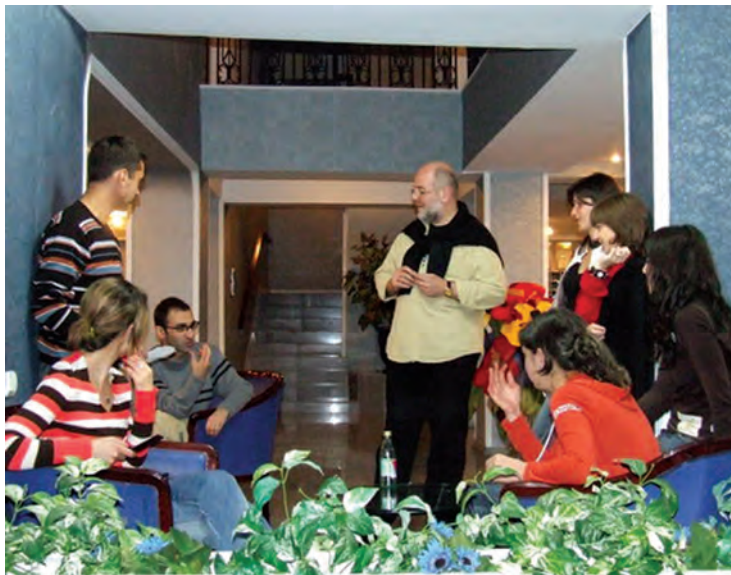
ჰაინრიხ ბიოლის ფონდი (2007): “ჟურნალისტთა ტრენინგი”, ბაკურიანი

ვკასიის ინსტიტუტი მშვიდობის, დემოკრატიისა და განვითარებისათვის”. პროექტის ეს ნაწილი ითვალისწინებდა კომპლექსური მედია-კამპანიის ჩატარებას, რაც ხელს შეუწყობდა ეთნიკური უმცირესობის წარმომადგენელი და ქალი ამომრჩევლების მონაწილეობას ქართულ პოლიტიკაში და ფართო საზოგადოებას მიზნობრივი ჯგუფების პრობლემებისა და ინტერესების შესახებ აუწყებდა. ტრენინგში მონაწილე საქართველოს სხვადასხვა