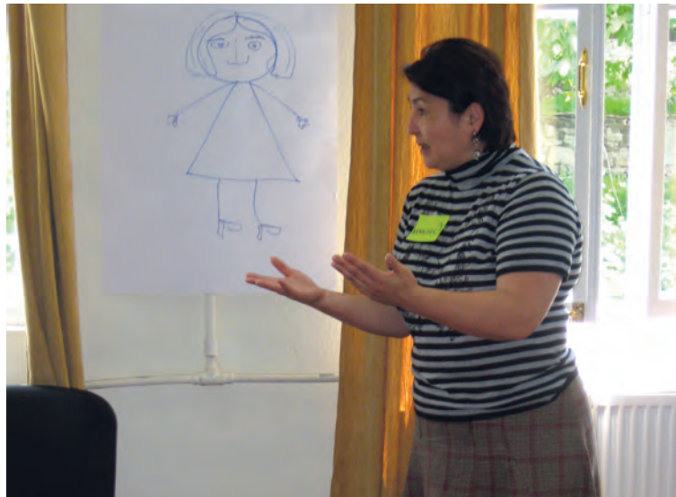
ჰაინრიჰ ბიოლის ფონდი (2009): “სემინარი ადგილობრივი თვითმმართველობისთვის”, ახალციხე

რომელიც შეეხებოდა პოლიტიკაში ქალთა რაოდენობას ადგილობრივ და ეროვნულ დონეებზე, აგრეთვე გენდერული დემოკრატიის პოლიტიკას და სტანდარტებს. ამომრჩეველთა განათლების პროგრამის დამატებით ელემენტად, ქალი ამომრჩეველების მოტივაციის გაზრდა ხდებოდა პიარ-აქციებით და ქალ კანდიდატებთან და პოლიტიკოსებთან შეხვედრების მეშვეობით. პროექტის ამ ნაწილის მიზანი გახლდათ, ქართველ ქალებში გაეჩინა შეგრძნება, რომ ისინი პოლიტიკური ცხოვრების განუყოფელ ნაწილს შეადგენენ, და იმავდროულად, დაერწმუნებინათ ისინი, გამოეყენებინათ საკუთარი საამომრჩეველო უფლებები. პროექტმა გარკვეული სახით შეძლო, ჩამოეყალიბებინათ თანამშრომლობა ქართულ პოლიტიკურ პარტიათა შორის და სათავე დაუდო გენდერული თანასწორობის მექანიზმის მიღებას როგორც პარტიულ სტრუქტურებში, ასევე მათ პროგრამებში. ამავე დროს, სხვადასხვა აქტივობებმა შესძინა ქალ ამომრჩეველებს, კანდიდატებს და პოლიტიკოსებს ცოდნა, უნარები და პოზიცია, რომ დაპირისპირებოდნენ შიდა პარტიულ იერარქებს და საზოგადოებრივ ცხოვრებაში საკუთარი ადგილი დაემკვიდრებინათ.