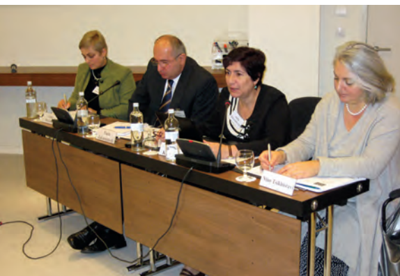
ჰაინრიჰ ბიოლის ფონდი (2009): “საერთაშორისო კონფერენცია”, თბილისი