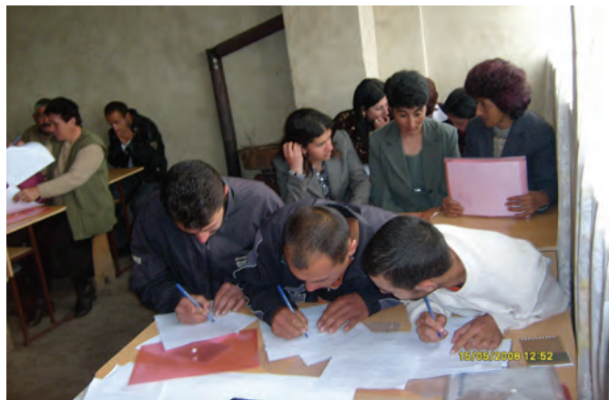
ჰაინრიჰ ბიოლის ფონდი (2008): “ამომრჩეველთა განათლების პროგრამა”, ახალქალაქი

ფერენციის მონაწილეებმა სოფელ იორმულანლოს მკვიდრთა პრობლემები შეაფასეს, როგორც შემაშფოთებელი და ერთმანეთს მოუწოდეს, დახმარებოდნენ ამ სოფელში მცხოვრებ უმცირესობის წარმომადგენლებს. იორმულანლო საგარეჯოს რაიონში მდებარეობს და იქ 21 ათასი ადამიანი ცხოვრობს. ეს სოფელი კახეთში ეთნიკური აზერბაიჯანლების ყველაზე დიდი და მჭიდრო დასახლებაა. აქ 800-მდე სასკოლო და ამდენივე სკოლამდელი ასაკის ბავშვია, მაგრამ ამ დასახლებას ჯერ კიდევ არ აქვს საბავშვო ბაღები. სკოლა პატარაა და ყველა მოსწავლეს ვერ იტევს. მაგრამ ყველაზე შემაშფოთებელი ისაა, რომ იორმულანლოს მოსახლეთა უმრავლესობა ოფიციალურად არც კი დაბადებულა, არ გაუვლიათ რეგისტრაცია საჯარო რეესტრში, არ არსებობენ ოფიციალურ სტატისტიკაში და არც დაბადების მოწმობები აქვთ, ამიტომაც, არ შეუძლიათ საგანმანათლებლო პროგრამებით სარგებლობა (იხ. სტატია 5). ამ ბავშვების სამოქალაქო აქტიურობა, განსაკუთრებით კი ხმის მიცემის უფლებები, გაურკვეველია, რადგან დაბადების მოწმობის არქონა პირადობის მოწმობის არქონას ნიშნავს, ამის გარეშე კი, ცხადია, შეუძლებელია არჩევნებში მონაწილეობა.