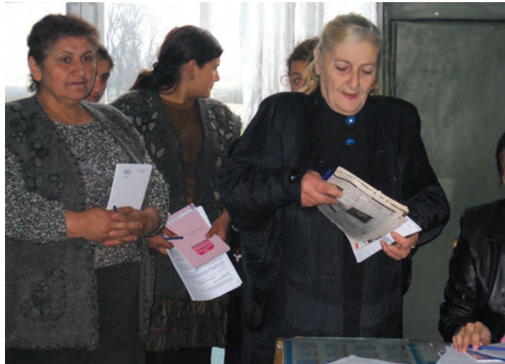
ჰაინრიჰ ბიოლის ფონდი (2008): “ამომრჩეველთა განათლების პროგრამა”, მარნეული

არასრულყოფილმა საარჩევნო სისტემამ, რომლის ნაკლად არა მხოლოდ ამომრჩეველთა არასრული სიები და გართულებული საარჩევნო პროცედურა შეიძლება დასახელდეს, ხალხს არჩევნებზე წასვლის სურვილი დაუკარგა. დემოკრატიული სტრუქტურების გამჭვირვალობა შეაფერხა პარტიების ბუნდოვანმა მანიფესტებმა, და ხშირ შემთხვევაში, მათმა სრულიად არქონამ ცხადყო, რომ პოლიტიკოსებს აშკარად აკლიათ პოლიტიკური ანგარიშვალდებულების გრძნობა და არ ითვალისწინებენ ამომრჩევე-