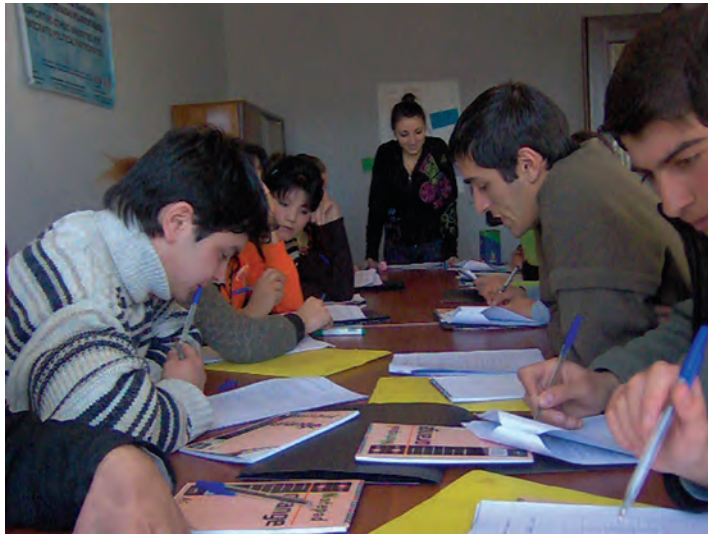
ჰაინრიჰ ბიოლის ფონდი (2007): “ამომრჩეველთა განათლების პროგრამა”, ახალქალაქი

ამომრჩეველთა განათლების კომპონენტი მომზადდა და განხორციელდა პარტნიორი ორგანიზაციის, სამოქალაქო კულტურის საერთაშორისო ცენტრის მიერ; მან საქმიანობაში ჩართო როგორც საკუთარი თანამშრომლები, ასევე ასოცირებული ტრენერები და კონსულტანტები. თავდაპირველად