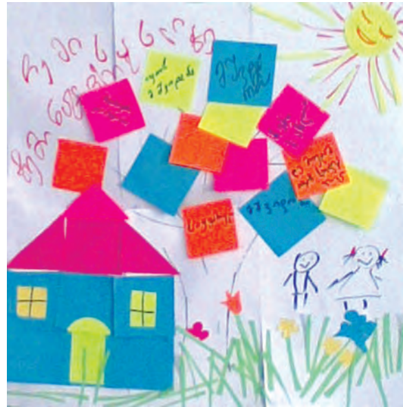
ჰაინრიჰ ბიოლის ფონდი (2008): “ტრენინგები რეგიონში მცხოვრებ ქალთათვის”, ნყალტუბო

ამ კონტექსტში არჩევნების წინ, მისი მიმდინარეობისას და მის შემდგომ, მედია-დაფარვის ხარისხი გადამწყვეტ როლს თამაშობს. შესაბამისად, პროექტი ითვალისწინებდა ტრენინგების ჩატარებას სხვადასხვა მედია-უნეებებში ჟურნალისტური რეპორტაჟების