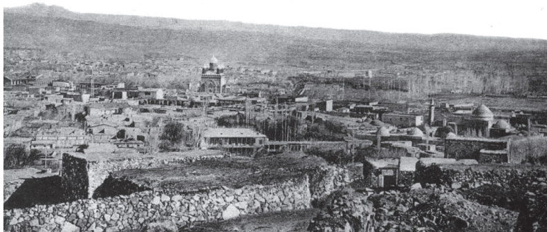
Фото 1. Панорама Еревана, 1900 г.

В структуре Еревана планировочно размечается ранее сложившееся функциональное зонирование с выделением торгового, социально-административного, промышленного, селитебного, зеленого районов. Входящие в плановую черту города участки дифференцируются по нескольким категориям: под застройку частными зданиями, для урегулирования улиц, “высочайше пожалованные” – отведенные городу правительством и т.п., в соответствии с ними местные власти проводят отводы и продажи городских земель. 7