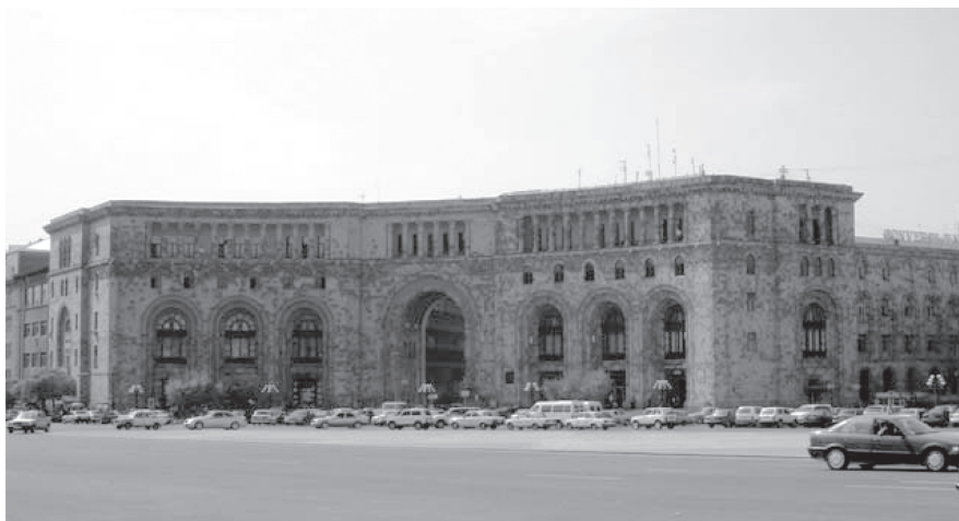
Фото 3. Здание Министерства транспорта и связи.