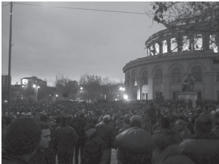
Фото 5. Демонстрации на площади Свободы. Март 2008 г.