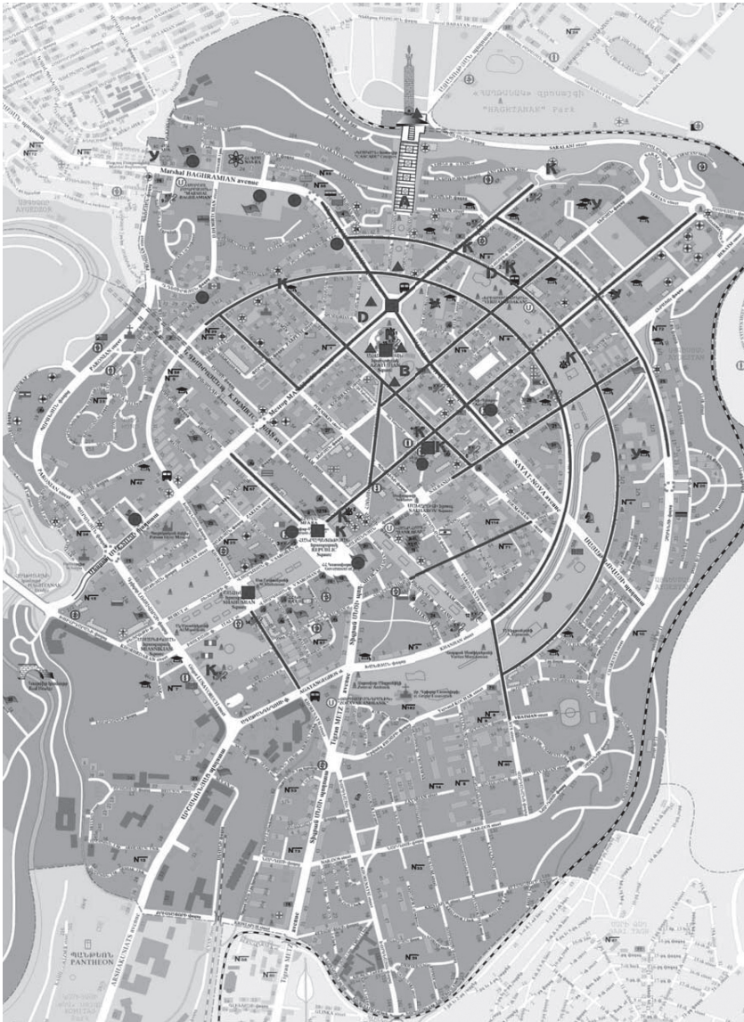
Иллюстрация 2. Ментальная карта центра Еревана.