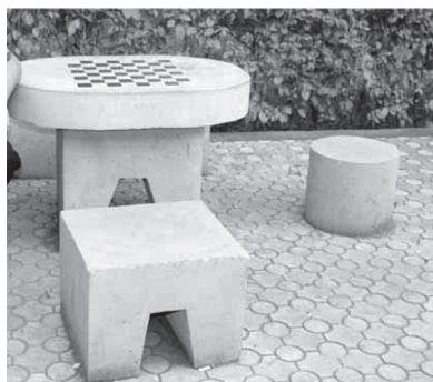
Фото 2. Каменные табурет и столик с выбитой шахматной доской.

Заметим, что элементы ереванской культуры встречаются на центральных улицах Еревана чаще в качестве городских скульптур и памятников. Так, на улице Абовяна, перед знаменитым в молодежно-интеллектуальных кругах арт-кафе “Art Bridge”, разместились каменные табуреты и столики с выбитой в них шахматной доской. 22