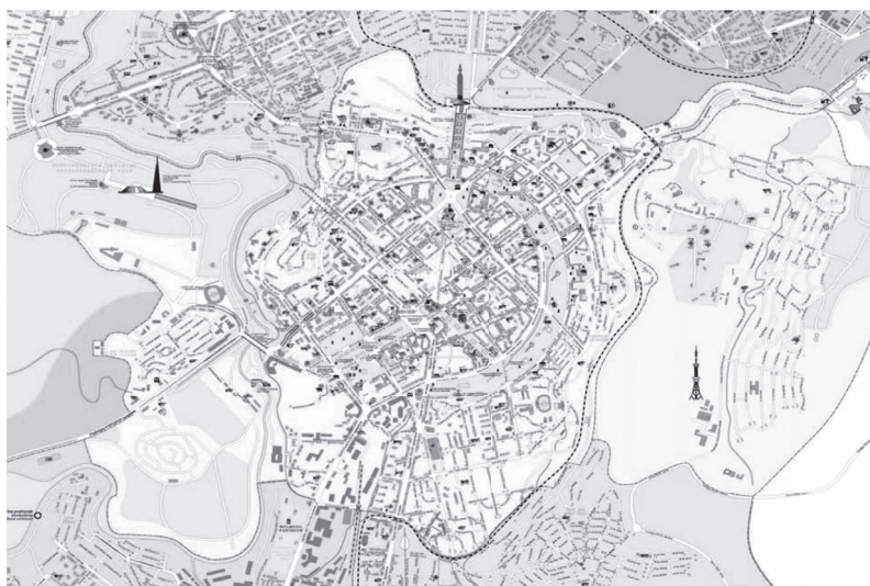
Иллюстрация 1. Карта Еревана. Центральный округ.

Ниже представлена карта Еревана, на которой выделен административный округ центра (Иллюстрация 1).