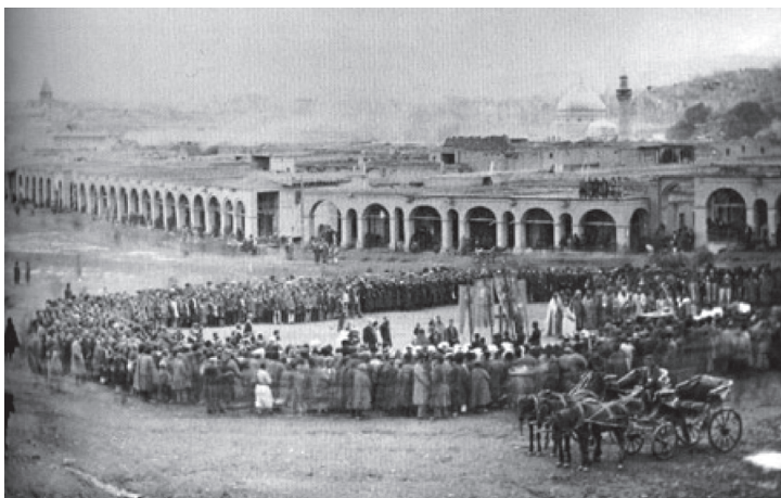
Фото 1. Торговая площадь. 1914 г.