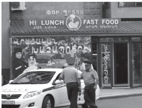
Фото 4. Основание здания ресторана “Старый Эриван”.

В качестве примера коннотативного диалога и/или конфликта между элементами в контексте городской среды можно привести здание ресторана “Старый Эриван”, который, как уже отмечалось, находится на углу Северного проспекта. Последний уже был рассмотрен выше в его семантическом контексте, однако