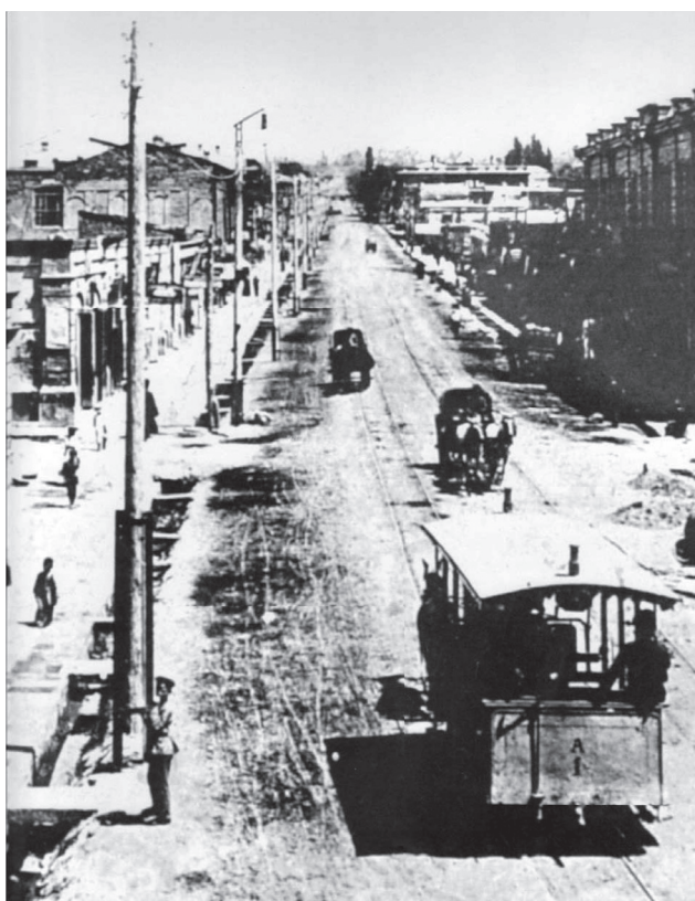
Фото 2. Ул. Астафяна, 1920 г.