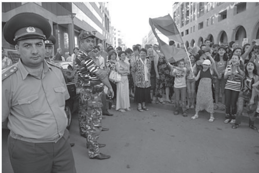
Фото 6. Демонстрации и политические гуляния на Северном проспекте. Май-июнь 2008 г.