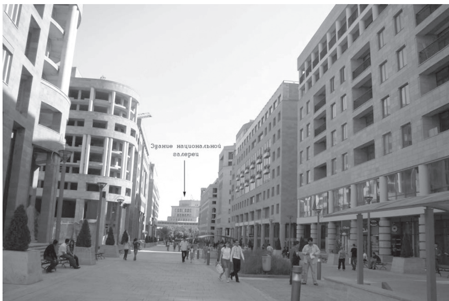
Фото 4. Северный проспект, нацеленный на здание Национальной галереи.