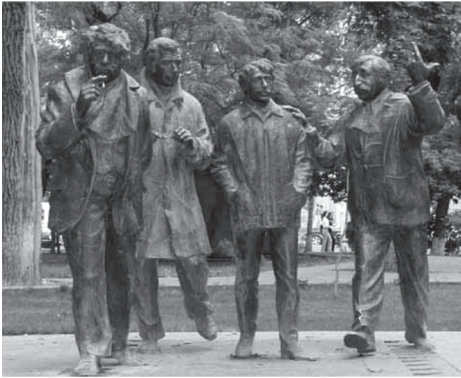
Фото 3. Памятник “Мужчинам”.

Модные тенденции не обходят даже нововозведенные памятники в сегодняшнем городском пространстве Еревана. Так, недавно установленная рядом с парком им. Сарьяна скульптурная группа “Мужчины” (Фото 3), отсылающая к одноименному армянскому фильму советского периода, не только репрезентирует гуманизованность современной культуры (учитывая масштабы па-