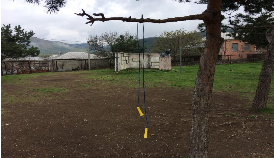
სოფელი დიდი დმანისი. ბავშვების მიერ სტადიონის ფუნქციით გამოყენებადი სივრცე