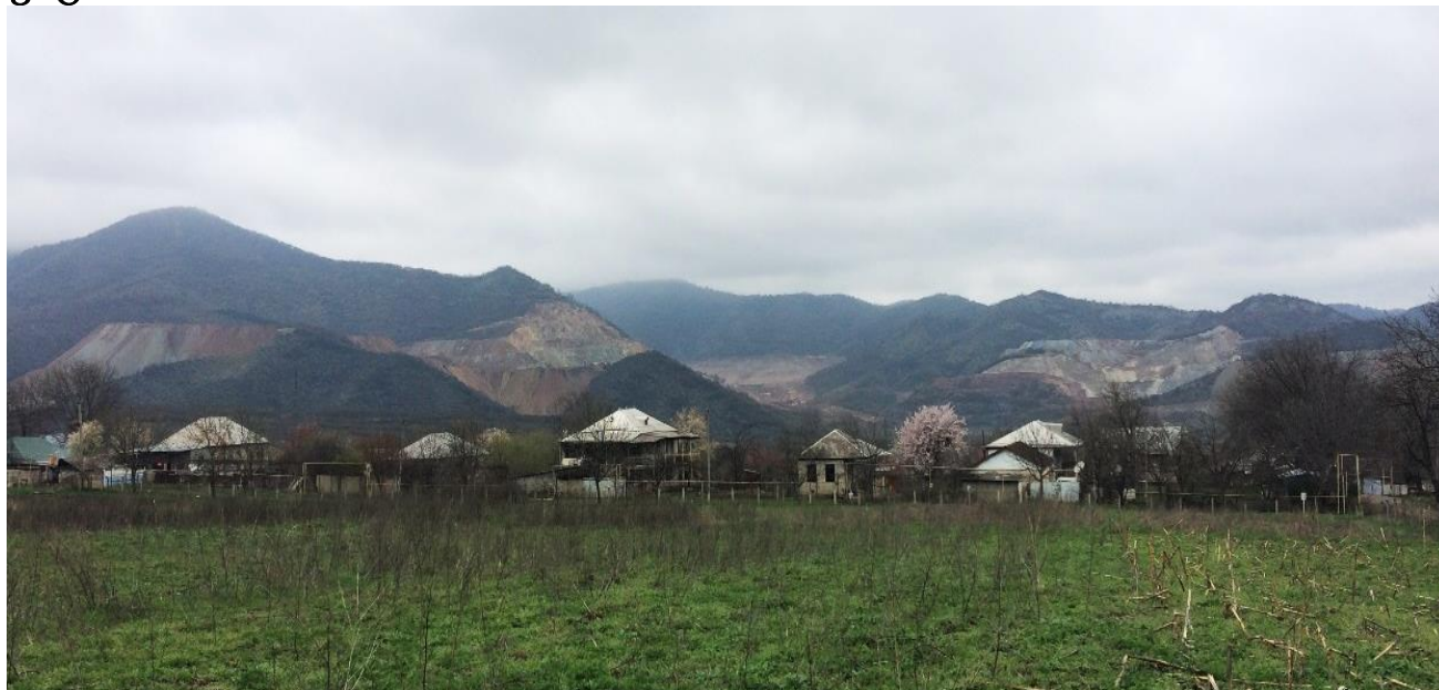
სოფელ ბალიჭისა და კომპანია „არემჯი“ კარიერების სიახლოვე