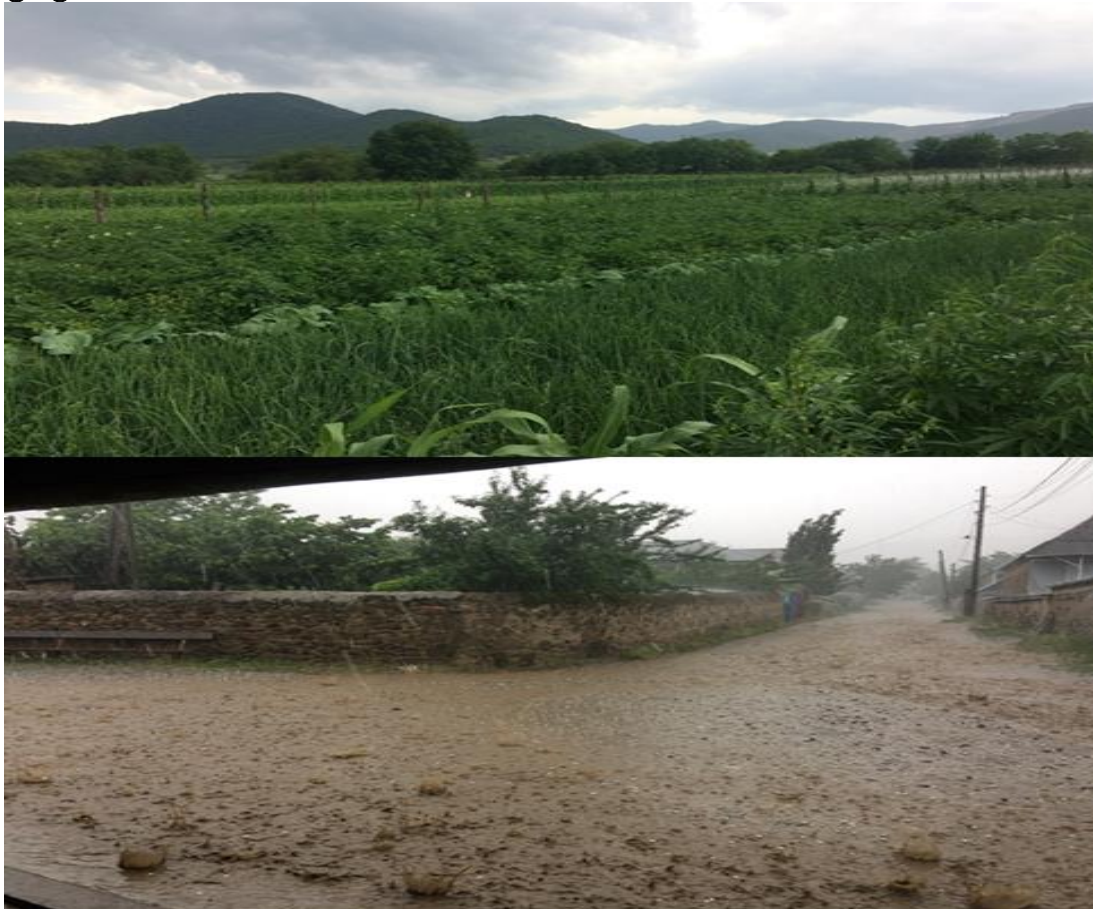
სოფელი ზემო ბოლნისი. საველე სამუშაოების დროს სოფელში მოსული სეტყვა, რომელმაც დააზიანა სოფლის მოსავალი.