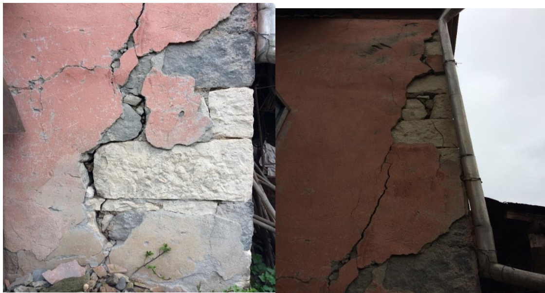
საწარმოს აფეთქებების შედეგად დაზარალებული საცხოვრებელი სახლი