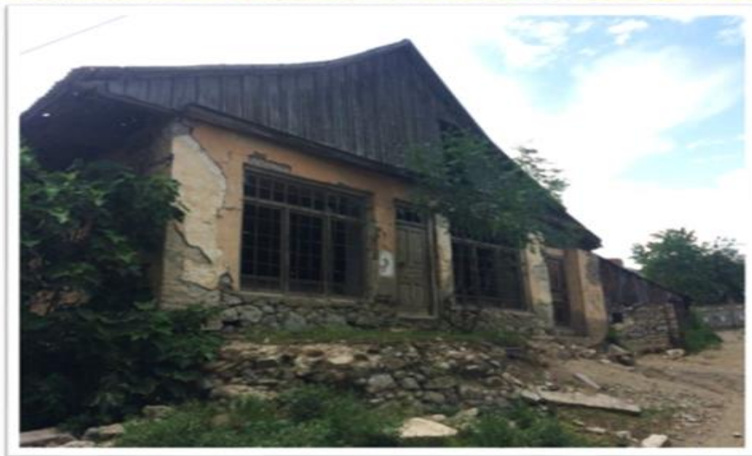
სოფელი ბოლნისი. მიტოვებული შენობები და საცხოვრებლები