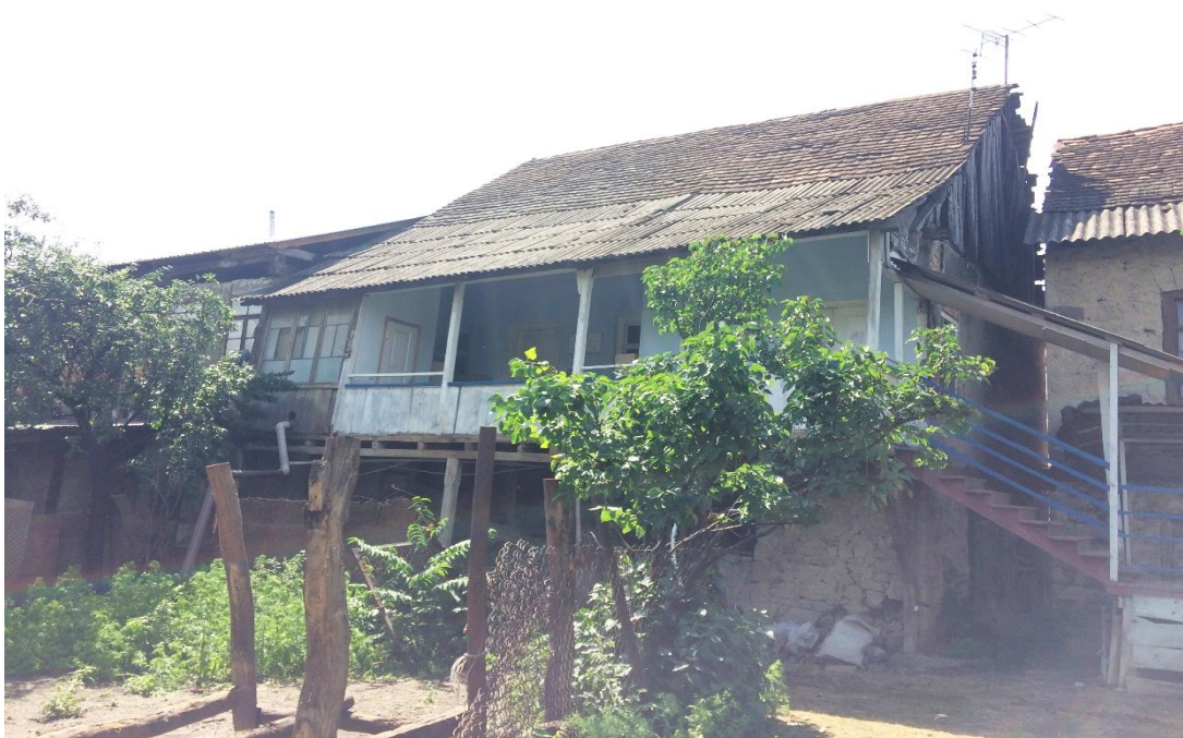
სოფელი ბოლნისი. სკოლა და საბავშვო ბაღი